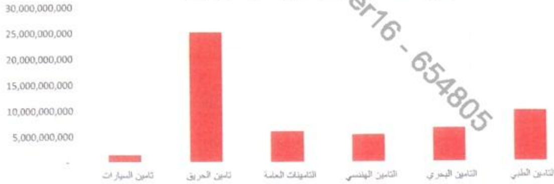
اجمالي اقساط الشركة حسب فروع تأمين لعام 2024