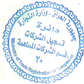
امثال قاسم محمد