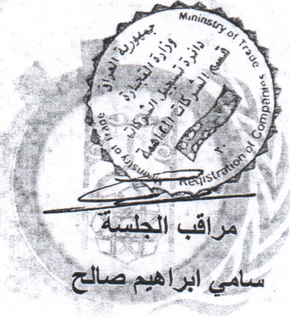
مراقب الجلسة سامي ابراهيم صالح