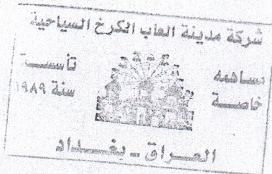
نعمه لطيف مهدي مراقب الجلسة