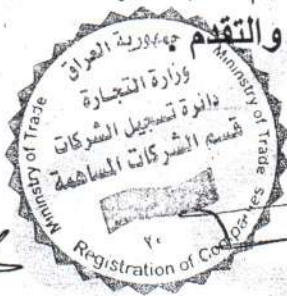
رئيس الهيئة العامة السيد

بالنظر لانتهاه مناقشة جميع فقرات جدول الاعمال واتخاذ القرارات بشأنها اعلن رئيس الهيئة العامة ختام الاجتماع شاكرا الحضور على مساهمتهم القيمة والمناقشات الهادفة وابداء الملاحظات التي تخدم المصرف نحو مزيد من التطور والتقدم