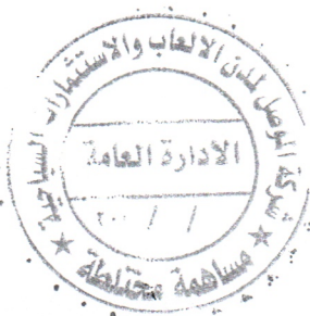
كاتب الجلسة علي صلاح الدين جمزة