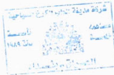
عسان صائب رجب مدير الحسابات