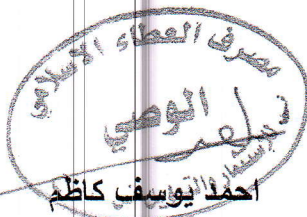
رئيس الهيئة العامة

وبالنظر لانتهاج جدول الاعمال فقد تم غلق المحضر والتوقيع عليه .